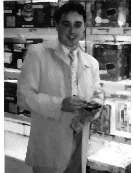
> Un commercial manifestement ravi d'utiliser un Palm dans son travail...

JA : j'apprécierais de pouvoir ajouter des notes concernant le point de vente, les changements de vendeurs, les départs en